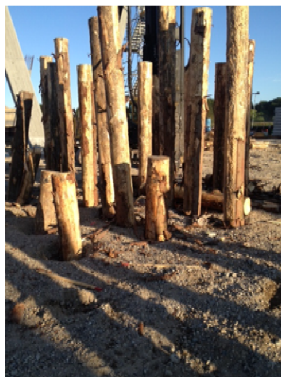
Udsnit af Roldskov