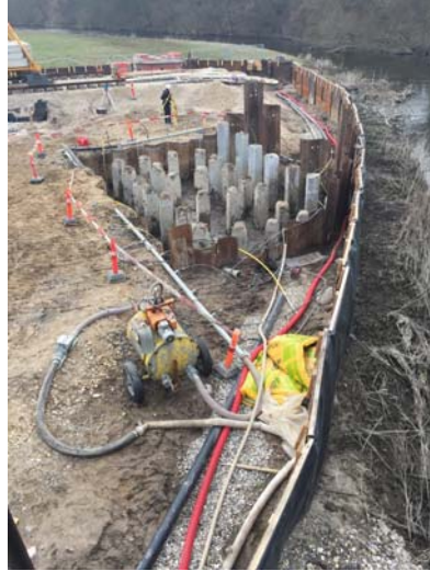
MLL 2 pælefundering