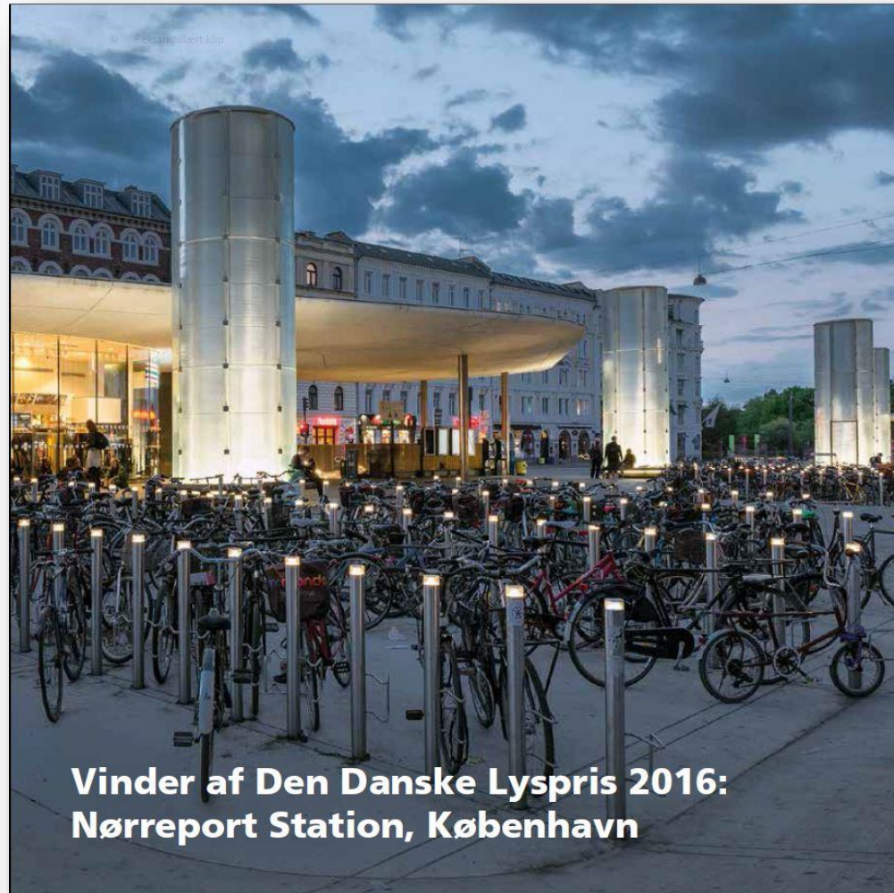
Vinder af Den Danske Lyspris 2016: Nørreport Station, København

Bygherre: Banedanmark, Københavns Kommune, DSB